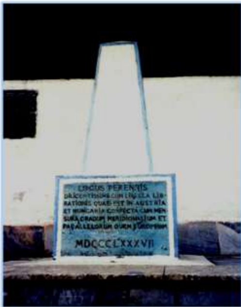
Рис.3 «Центр Європи» с.Ділове Рахівського району

Що стосується австро-угорських карт на територію Чехословаччини, то більшість їх були у 1919-1926 рр. передані ВГІ у Прагу. Після оновлення цих карт (або нового знімання) на основі нових умовних знаків та після узгодження місцевих назв з чеською транскрипцією (на теренах Словаччини і Закарпаття це виконав відомий славіст Лубор Нідерле), їх видавали (до 1938 р. включно) у вигляді атласів ЧСР, шкільних географічних атласів, атласів автомобільних шляхів, оглядових, політичних, шляхових, туристичних та тематичних карт, карт для енциклопедій тощо.