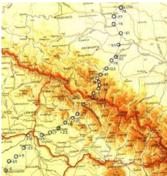
Рис.5 Фрагмент карти на якій нанесені точки гравіметричних вимірювань д-р Роберта Даублеску фон Штернека в Західній Українській республіки(1938р.)

У розділі «Podkarpatská Rus» наведені три топографічні карти, складені ВГІ у Празі.