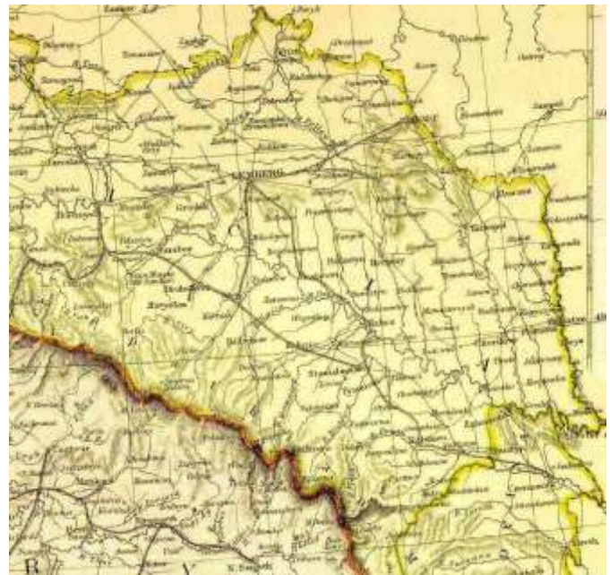
Рис.4 Галичина, Буковина і Закарпаття на фрагменті австрійської карти(1914 р.)