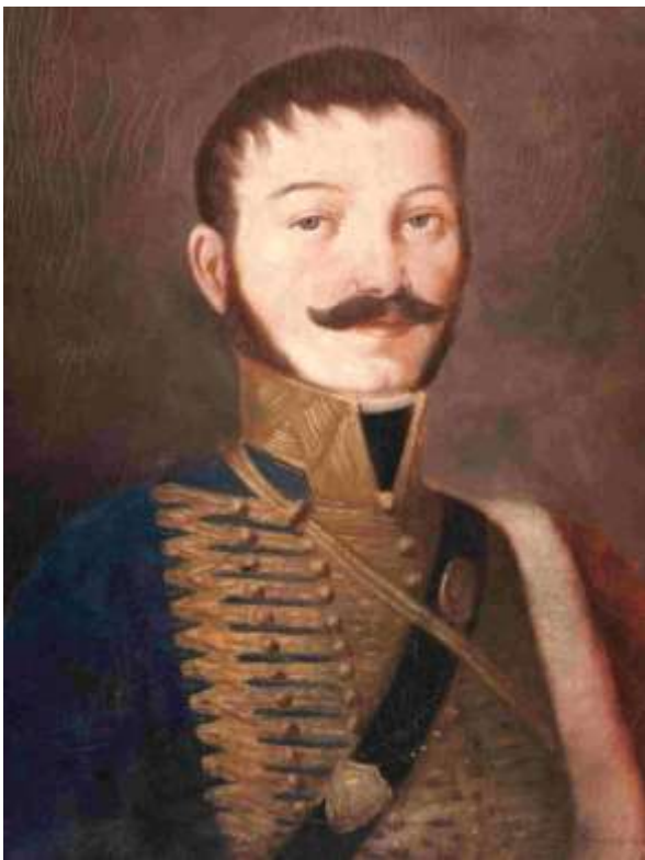
Рис.1. Гусарський полковник австро-угорської армії Ян Ліпски

Серед творців цих карт були також чехи і словаки. Одним з них був відомий військовий картограф та гусарський полковник австро-угорської армії Ян Ліпски (1766-1826), який у 1792-1799 рр. служив в Західній Україні, зокрема, в Садгорі біля Чернівців, Снятині (тепер Івано-Франківська обл.) та Зборові (тепер Тернопільська обл.). У 1804-09 рр. він створив найвідомішу карту Угорського королівства (з Закарпаттям) «Mappa generalis regni Hungariae...» в масштабі 1:469